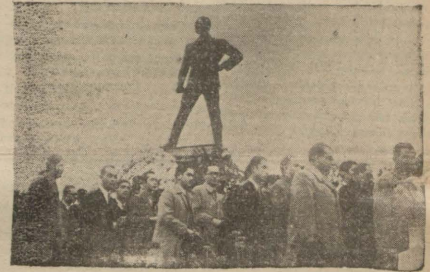
Dün gençlik Sarayburnunda Atatürk heykeli'nin önünden geçerken

Ankara'da Millî Şef, hükümet erkânı ile birlikte Atatürk'ün manevî huzurlarında bir tazim vakfesinde bulundular