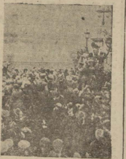
11 İkinciteşrin 1918 günü akşamı Londrada kral sarayı önünde tezahürat yapan halk

(Bu sayıyı idikkat yazıyı bugün 3 üncü sayfamızda bulacaksınız)