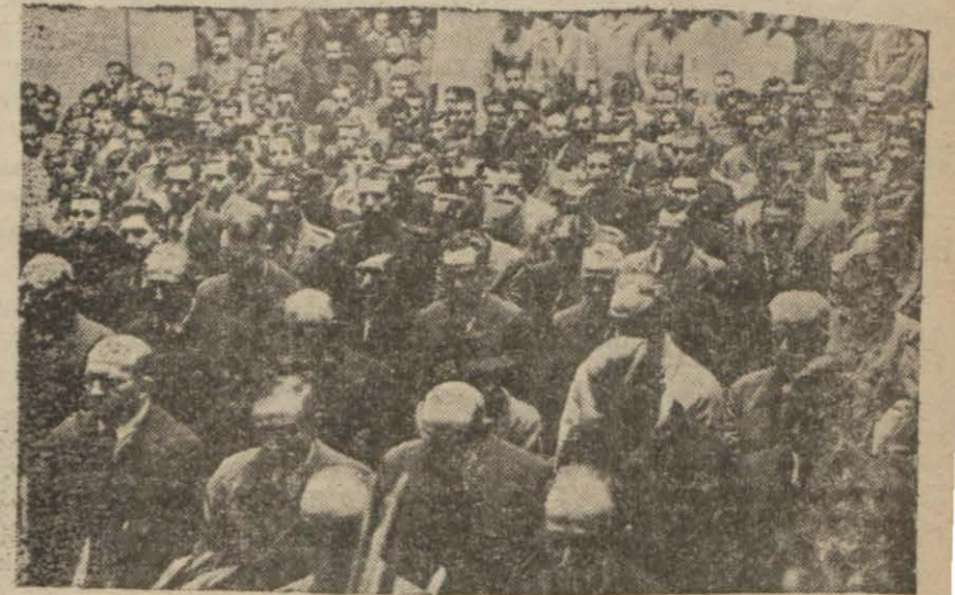
Üniversitede yapılan toplantıdan bir intiba

Cumhuriyetimizin bânisi, Ebedî Şef Atatürk'ün ölümünün üçüncü yıldönümü münasebetiyle dün memleketin her tarafında olduğu gibi şehrimizde de ihtifaller yapılmış, onun mukaddes hatırası taziz olunmuştur. İstanbul bu yası gününde derin bir sessizliğe bürünmüş, bütün resmi ve hususî binalarda bayraklar matem alâmeti olarak yarısına kadar indirilmiş, eğlence yerleri kapalıdır. Sa - bah saat 8,30 dan itibaren bütün Halkevlerle Üniversite ve bütün okullarda toplantılara başlanmıştır.